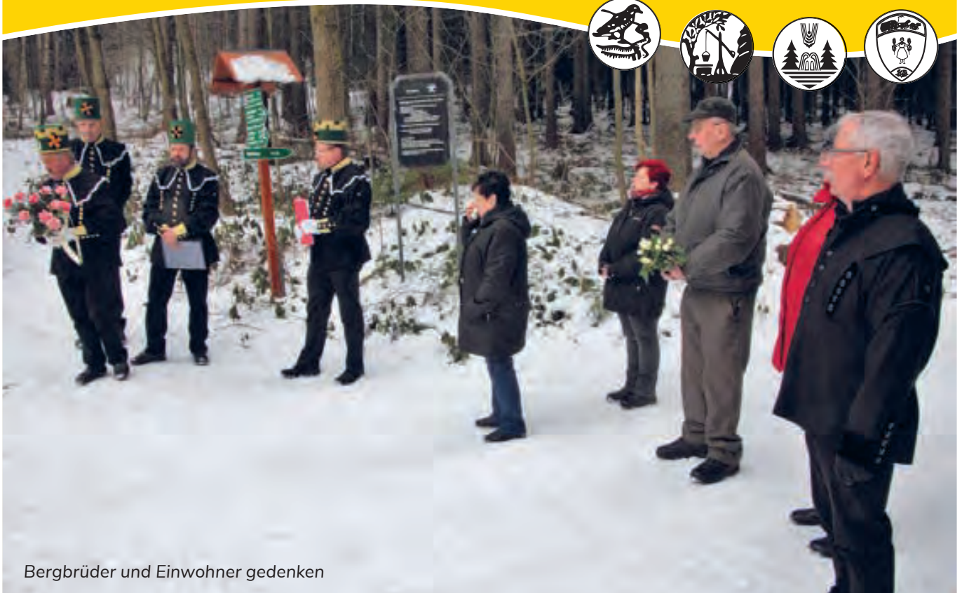
Bergbrüder und Einwohner gedenken