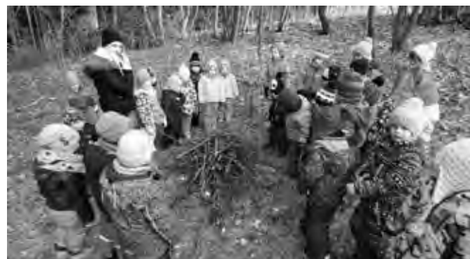
Aufgabe gelöst – Lagerfeuer steht

In der zweiten Woche brachen die Küken, Kätzchen und Bären zu einer spannenden Schnipsel-Jagd auf. Bunte Schnipsel zeigten den Kindern den Weg zu einem Schatz. Unterwegs befanden sich Aufgabenkarten, die von den Kindern gemeinsam gelöst werden mussten z. B. sollten Stöcke gesammelt und zu einem Lagerfeuer aufgestellt werden oder an einem steilen Hang sollten die Kinder wie ein Tausendfüßler gehen. Alle Aufgaben wurden mit Geschick und gegenseitiger Unterstützung absolviert und somit auch der Schatz gefunden. Jedes Kind durfte als Andenken eine kleine Schatzkiste mit nach Hause nehmen.