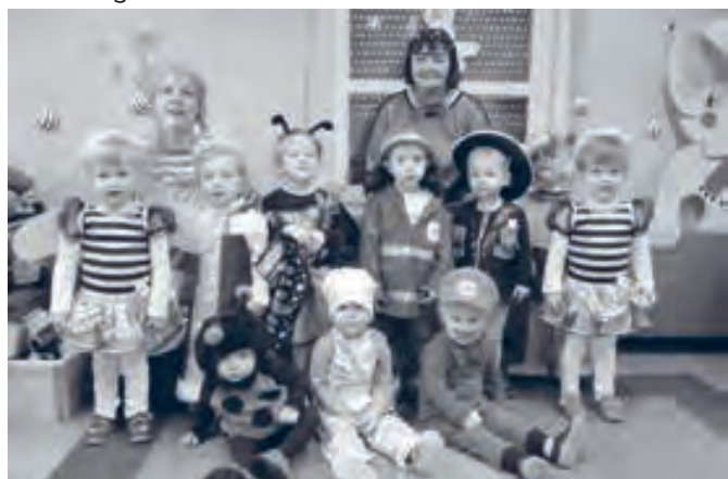
Unsere kleinsten Faschingsnarren

Zu Beginn wurde eine zünftige Faschingsparty gefeiert. Am Morgen stärkten sich alle Narren an einem bunt an-